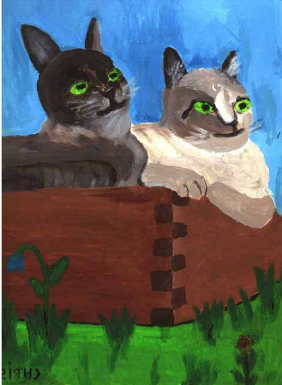
Katzenwesen des Planeten Boruthia