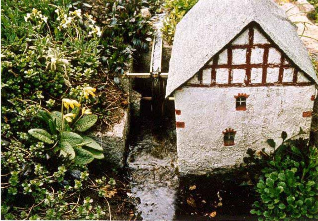
Mühle im Garten, 1974