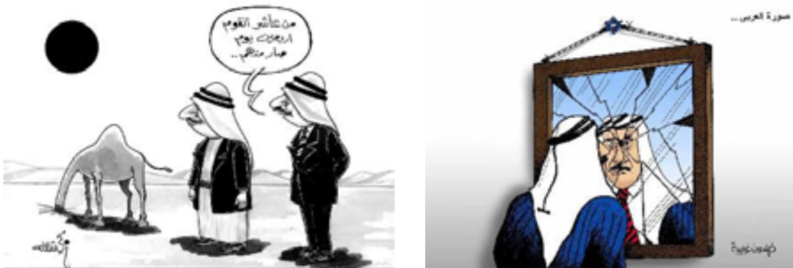
Bild: Karikaturen aus einer jordanischen Zeitung

Im Koran sind Bilder nicht grundsätzlich verboten, außer solche von Gott. In arabischen Zeitungen gibt es regelmäßig Karikaturen, auch über eigene Politiker, und mir wurde von einem Muslim ferner ein Buch gezeigt, das Fotos von modernen Wandbildern in Ägypten enthält, die Menschen, Tiere und sogar Abraham mit einem Engel darstellen! Wenn also jemand Karikaturen über islamische Terroristen zeichnen will, dann kann er das selbstverständlich tun, er muss lediglich auf Bilder von Gott und auf bössartige Bilder von Mohammed verzichten.